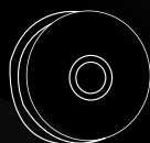
FILAMENTO 1.75 mm